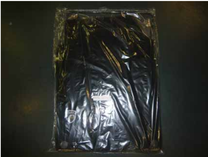
Abbildung /Figure 4: Lieferumfang /Supplied parts