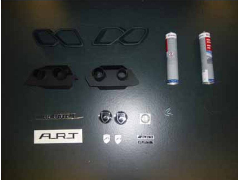
Abbildung /Figure 3: Lieferumfang /Supplied parts

Mercedes-Benz S-Klasse Mercedes-Maybach S-Klasse