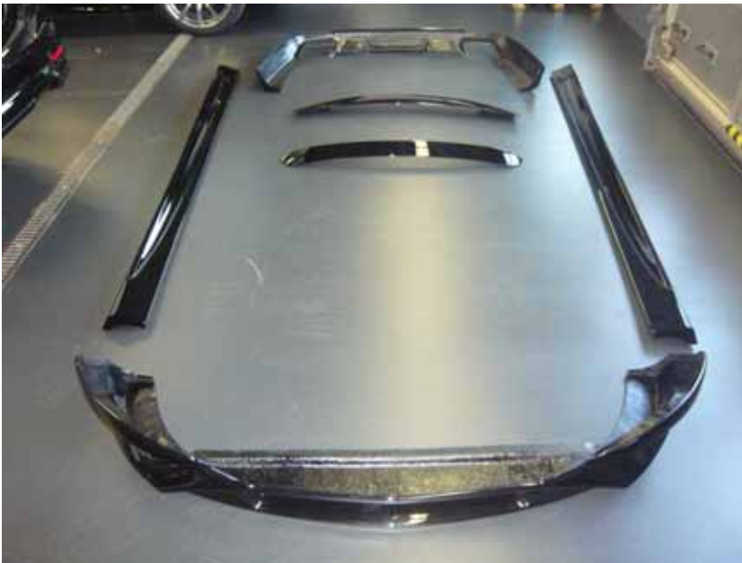
Abbildung /Figure 2: Lieferumfang /Supplied parts