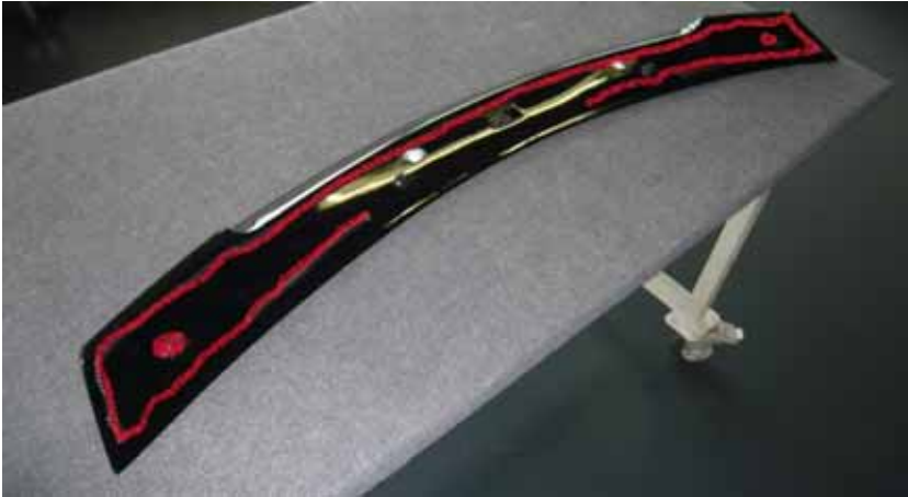
Abbildung /Figure 15: A.R.T. Heckspoiler mit Klebeflächen /A.R.T. Rear Spoiler with adhesive aereas

Mercedes-Benz S-Klasse Mercedes-Maybach S-Klasse