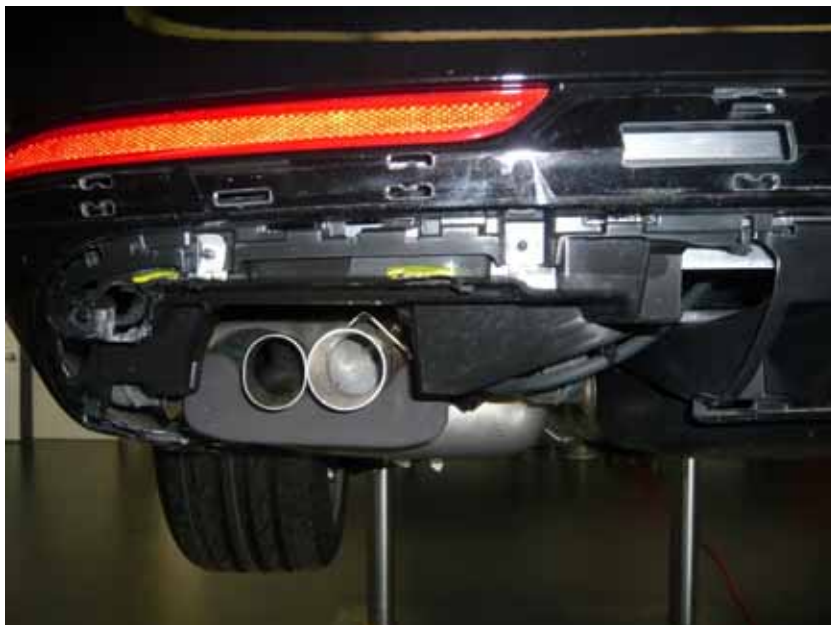
Abbildung /Figure 23: Ausschneiden der original Heckschürze /Cutout of the original rear skirt