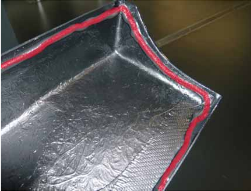
Abbildung / Figure 9: Seitenschweller Klebeflächen / Side Skirts adhesive areas

Mercedes-Benz S-Klasse Mercedes-Maybach S-Klasse