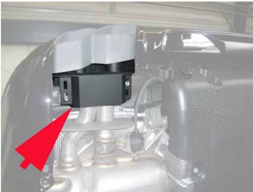
Abbildung /Figure 20: Adapter für A.R.T. Auspuff Blenden /A.R.T. End Pipes Adapter