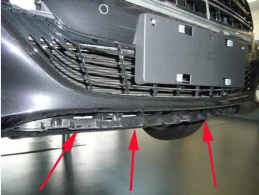
Abbildung /Figure 6: Original Frontschürze ohne Chrom Blende /Original front skirt without chrome strip

Mercedes-Benz S-Klasse Mercedes-Maybach S-Klasse