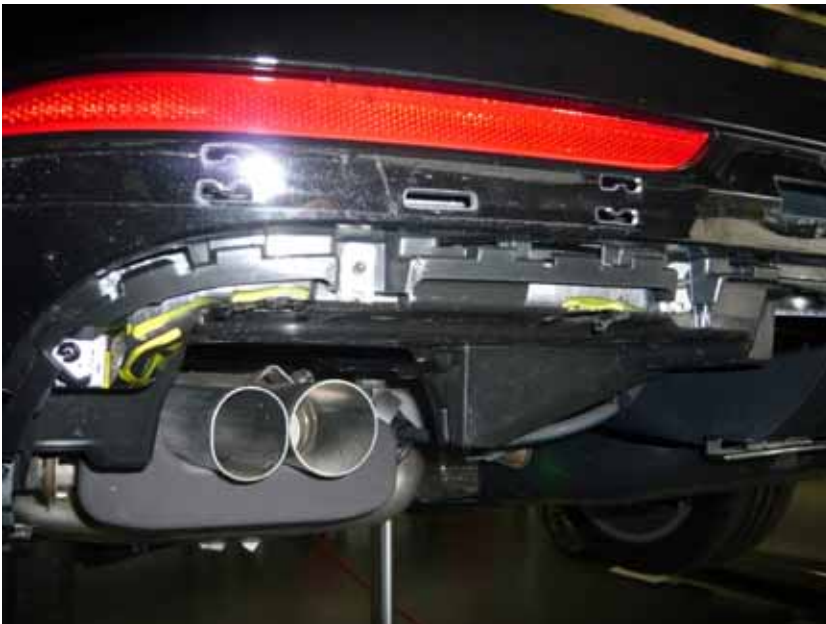
Abbildung / Figure 22: Ausschneiden der originalen Heckschürze / Cutout the original rear skirt