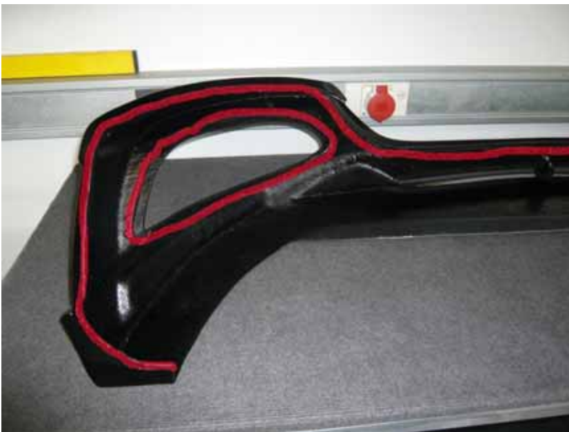
Abbildung /Figure 7: A.R.T. Frontlippe mit Klebeflächen /A.R.T. Front Lip with adhesive areas