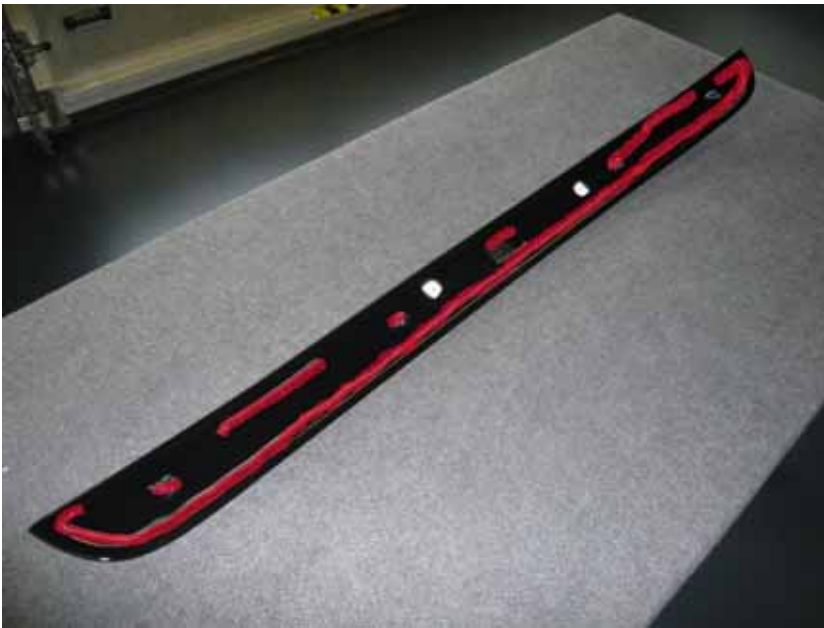
Abbildung /Figure 13: A.R.T. Dachspoiler Klebeflächen /A.R.T. Roof Spoiler with adhesive areas