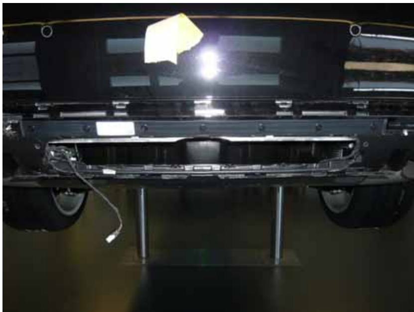
Abbildung /Figure 24: Aussparungen für Nebelschlußleuchte vergrößern /Cutout for the fog lamps