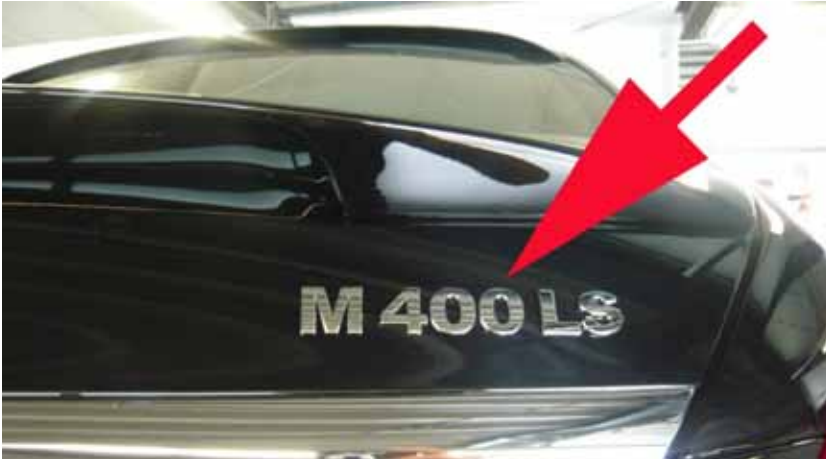
Abbildung / Figure 33: SR02 222 00 für Heckklappe / A.R.T. Lettering for trunk lid

Mercedes-Benz S-Klasse Mercedes-Maybach S-Klasse