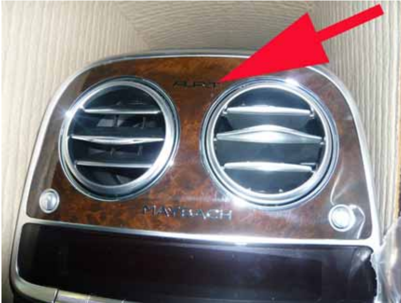
Abbildung / Figure 35: SR30 3x4 00 für Mittelkonsole hinten / A.R.T. Lettering for rear center console

Mercedes-Benz S-Klasse Mercedes-Maybach S-Klasse