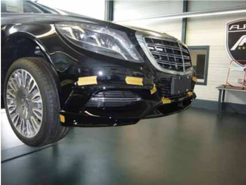
Abbildung / Figure 8: A.R.T. Frontlippe montiert / A.R.T. Front Lip mounted

Mercedes-Benz S-Klasse Mercedes-Maybach S-Klasse