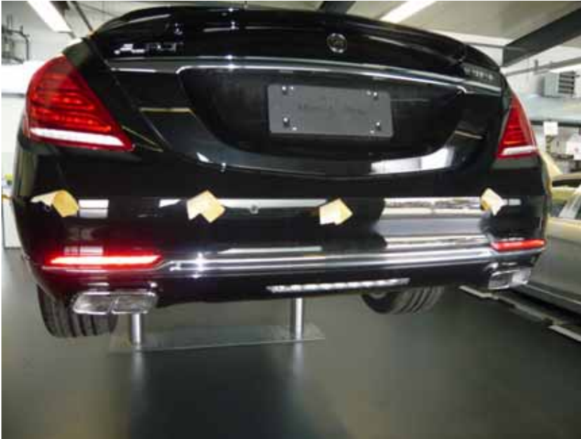
Abbildung /Figure 17: Original Heckschürze /Original rear scirt

Mercedes-Benz S-Klasse Mercedes-Maybach S-Klasse