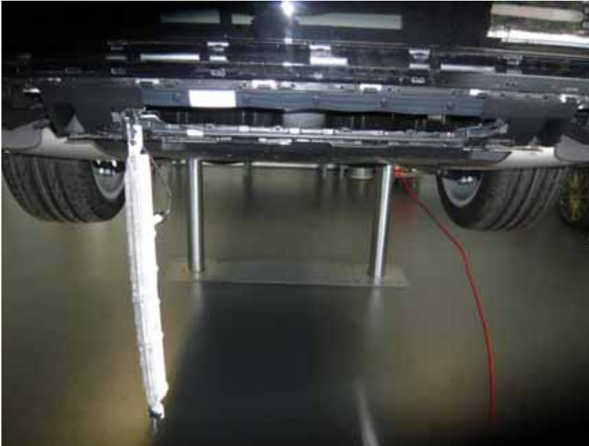
Abbildung / Figure 27: Entfernung der Nebelleuchte / Remove the fog light

Mercedes-Benz S-Klasse Mercedes-Maybach S-Klasse