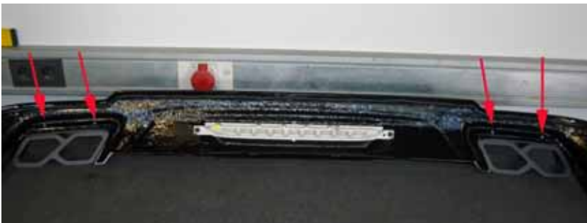
Abbildung /Figure 26: A.R.T. Auspuff Blenden /A.R.T. End Pipes