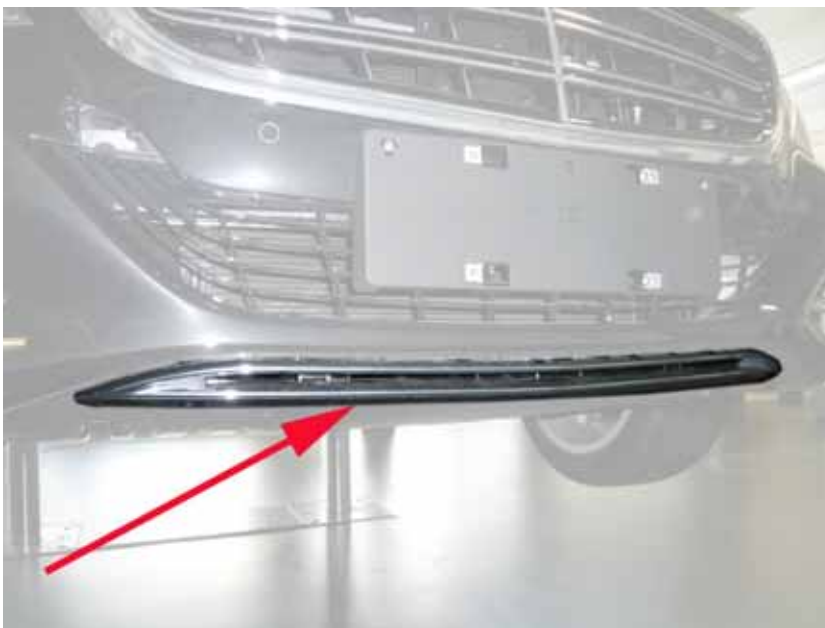
Abbildung /Figure 5: Original Frontschürze mit Chrom Blende / original front skirt with chrome strip