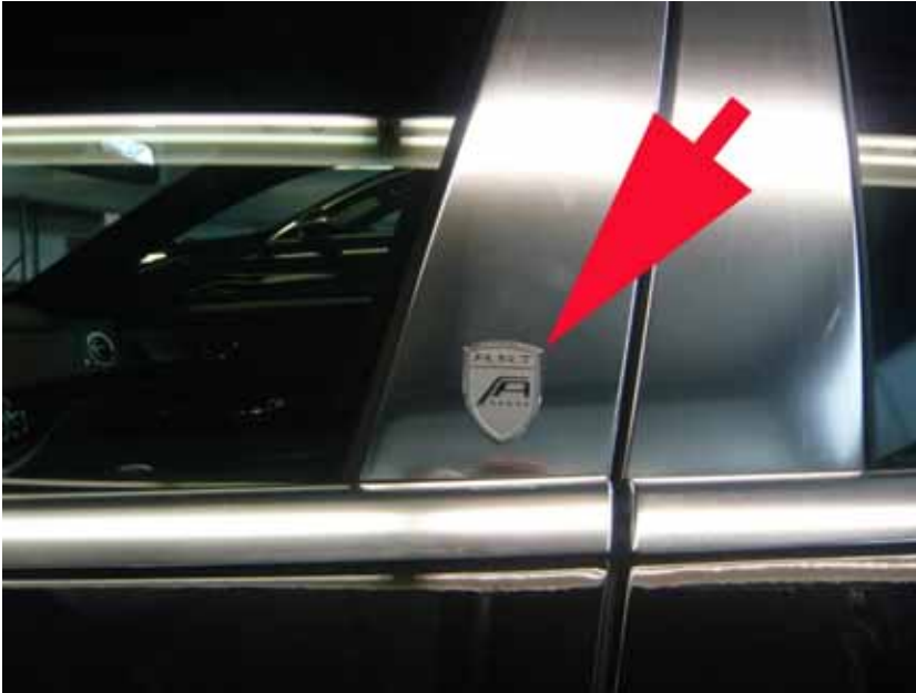
Abbildung / Figure 29: SR60 100 00 für B-Säule / A.R.T. Logos for B-pillar

Mercedes-Benz S-Klasse Mercedes-Maybach S-Klasse