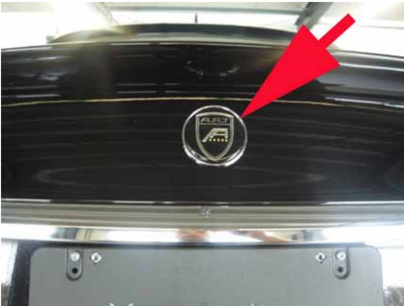
Abbildung /Figure 32: SR05 100 00 A.R.T. Wappen Emblem für Heckklappe /for trunk lid