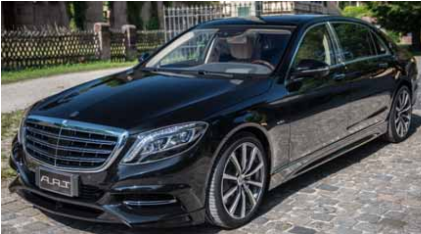
Abbildung /Figure 1: A.R.T. M LS