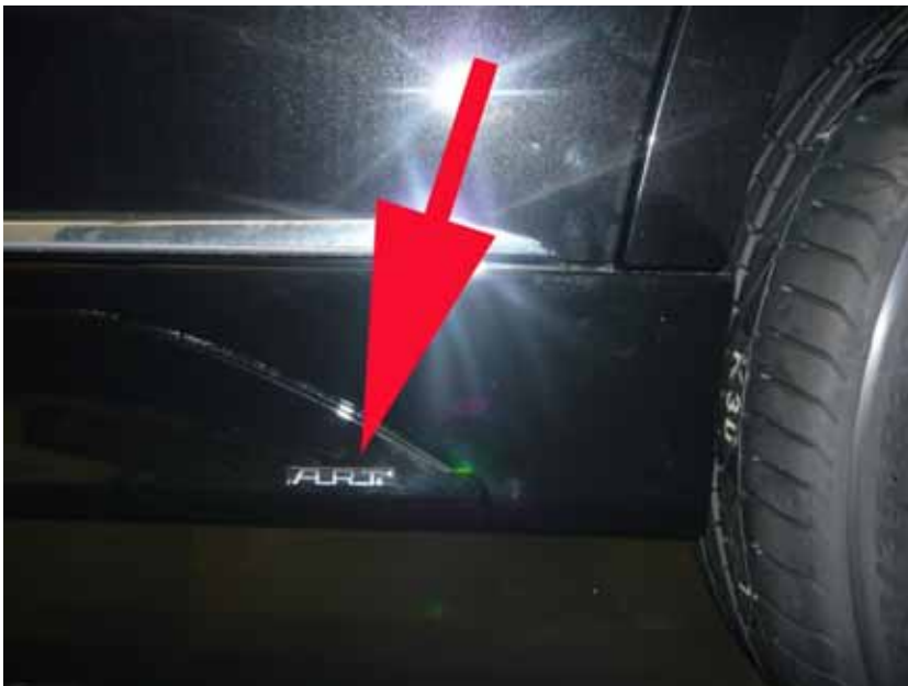
Abbildung /Figure 28: SR01 100 00 für Seitenschweller /for side skirts

Place the A.R.T. Logos according to the following illustrations