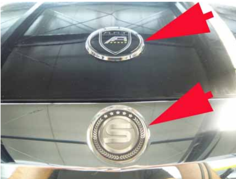
Abbildung / Figure 30: SR05 100 10 + SR01 222 00 für Kühlerhaube / A.R.T. Logos for bonnet