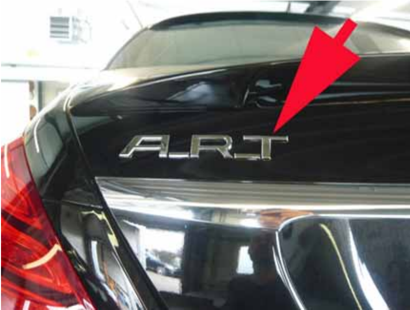
Abbildung /Figure 31: SR50 100 00 A.R.T. Schriftzug für Heckklappe /A.R.T. Lettering for trunk lid

Mercedes-Benz S-Klasse Mercedes-Maybach S-Klasse