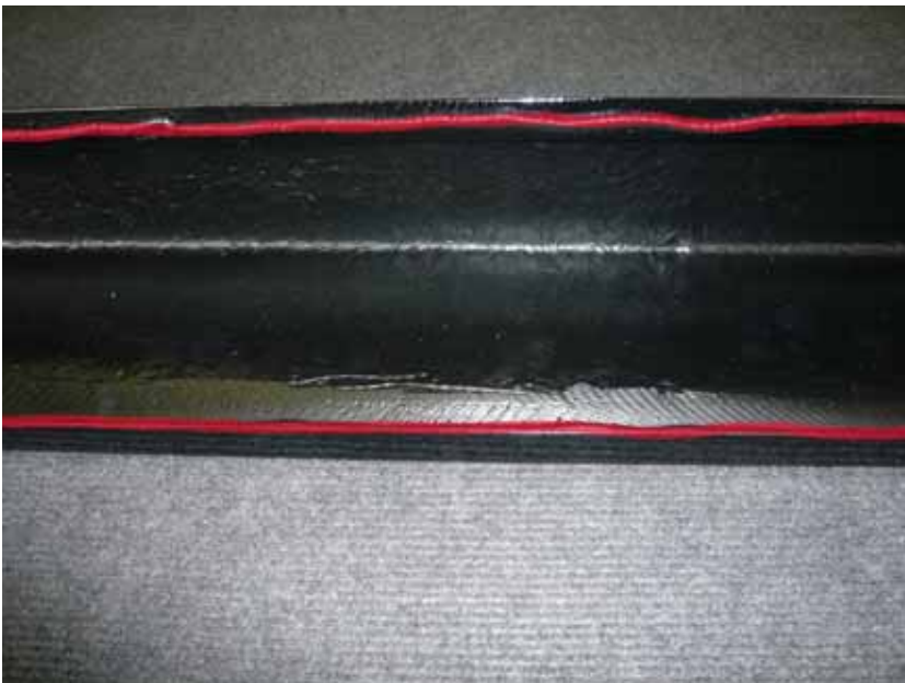
Abbildung / Figure 10: Seitenschweller Klebeflächen / Side Skirts adhesive areas