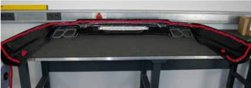
Abbildung / Figure 21: Heckdiffusor Klebeflächen / Rear Diffusor adhesive areas

Mercedes-Benz S-Klasse Mercedes-Maybach S-Klasse