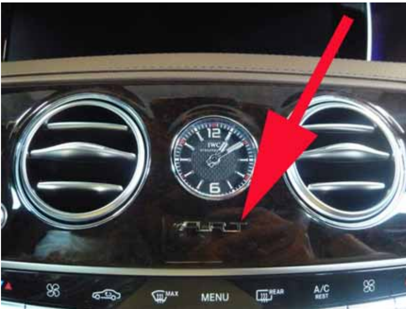
Abbildung / Figure 34: SR30 3x4 00 für Armaturenbrett / A.R.T. Lettering for Dashboard