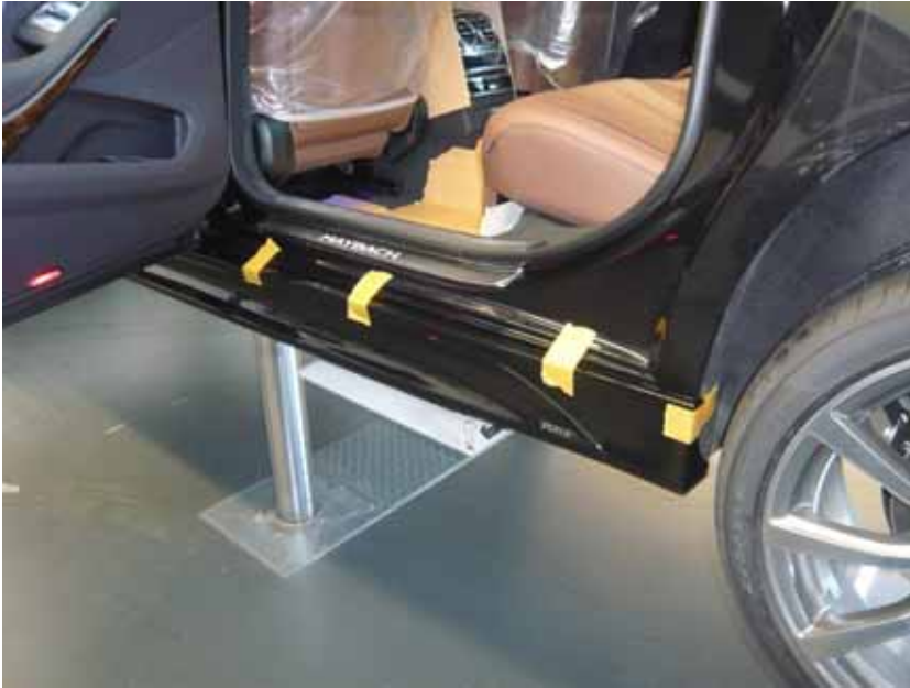
Abbildung / Figure 11: Seitenschweller montiert / Side Skirts mounted

Mercedes-Benz S-Klasse Mercedes-Maybach S-Klasse