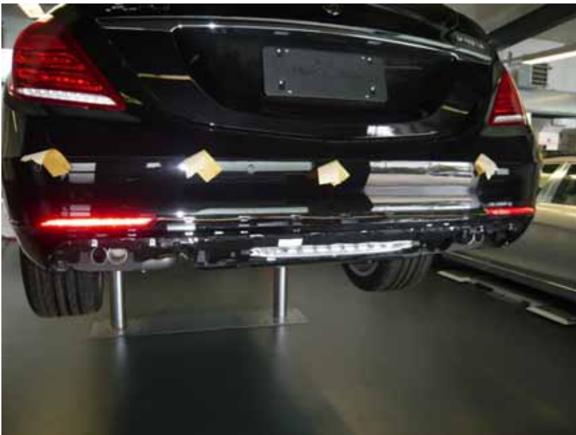
Abbildung /Figure 18: Original Heckschürze ohne Chrom Blende, Heckblende und auspuffblenden /Original rear scirt without chrome strip and rear strip