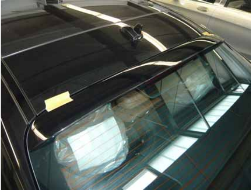
Abbildung / Figure 14: A.R.T. Dachspoiler fertig montiert / A.R.T. Roof Spoiler mounted

Mercedes-Benz S-Klasse Mercedes-Maybach S-Klasse