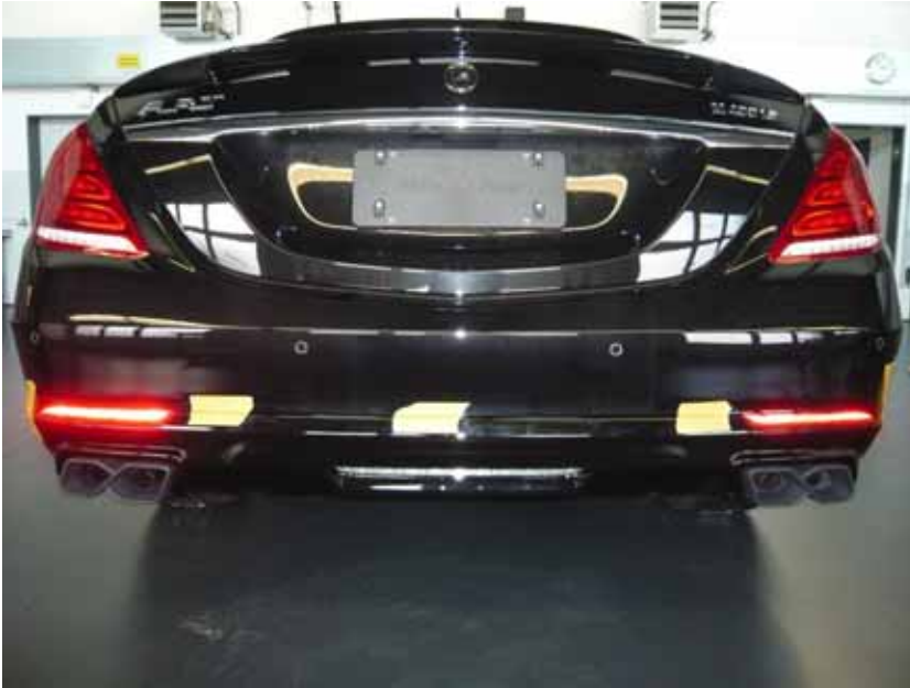
Abbildung /Figure 25: A.R.T. Heckdiffusor fertig montiert /A.R.T. Rear Diffusor mounted

Mercedes-Benz S-Klasse Mercedes-Maybach S-Klasse