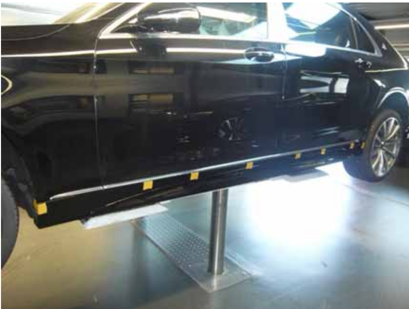
Abbildung / Figure 12: Seitenschweller montiert / Side Skirts mounted