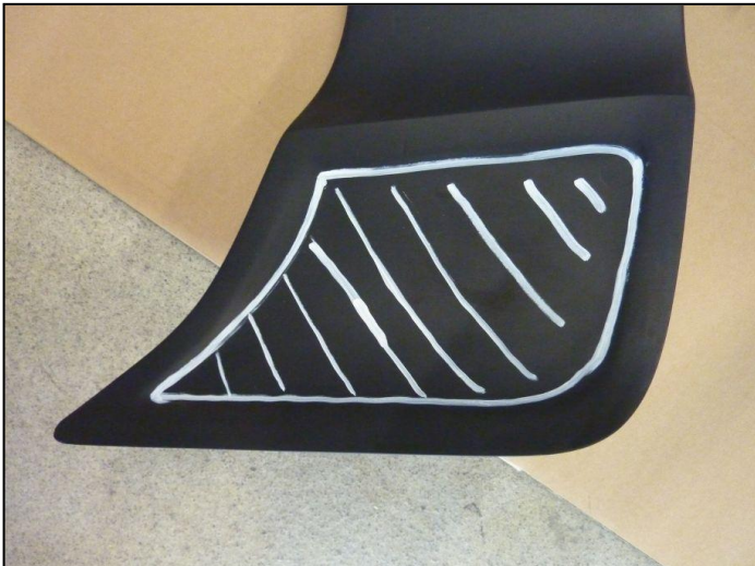
Bild 6: Bereich für Position der Löcher für Blechschrauben Fig. 6: space for position of holes for self-tapping screws

Remove roof spoiler again. Drill 2 holes (one per side) through the roof lining in the space of the contact face (fig. 6) for the self-tapping screws.