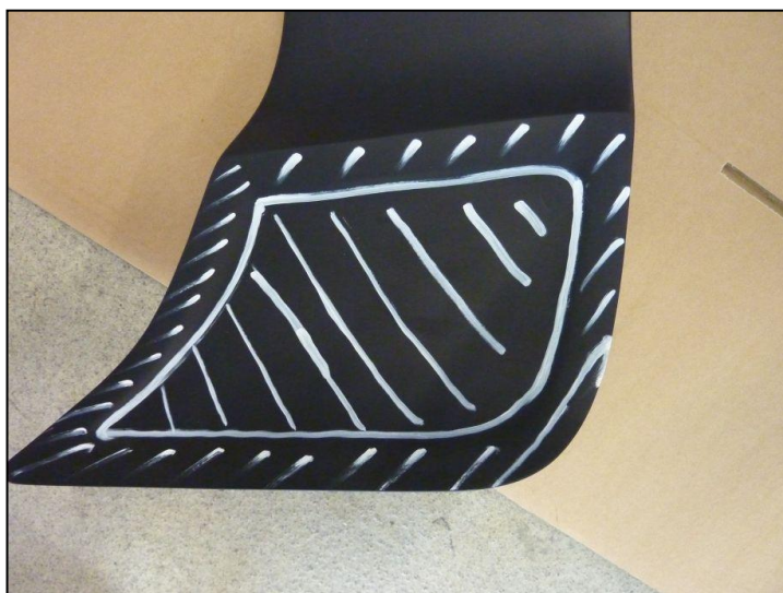
Bild 8: Kontaktfläche für Kleber, rechts Fig. 8: contact face for adhesive, right side

Take off the masking band. Apply adhesive to the complete contact face of the roof spoiler (fig. 8). Put the roof spoiler carefully onto the roof, meanwhile put the cable of the brake lamp through the corresponding hole in the roof. Put the roof spoiler in place, align it and position and tighten the screws. Remove surplus adhesive immediately. If required, please request the material safety data sheet for this adhesive from A.R.T.