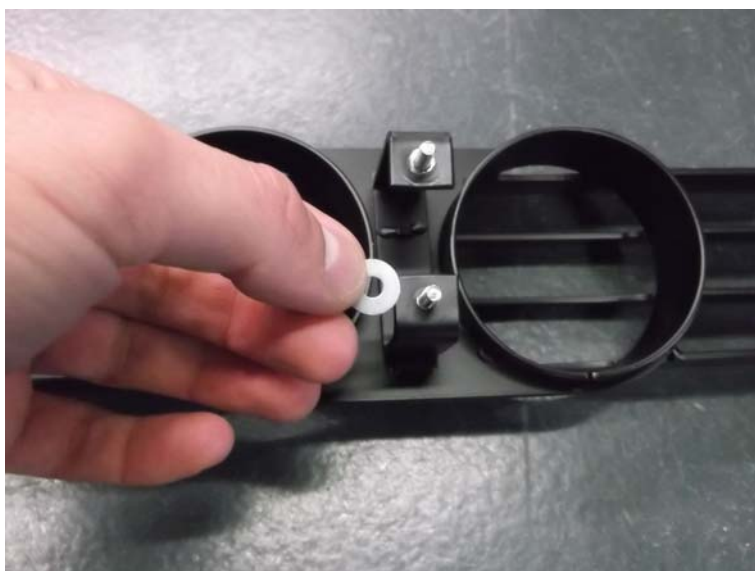
Bild 10: Unterlegscheiben zwischenlegen Figure 10: Insert flat washer