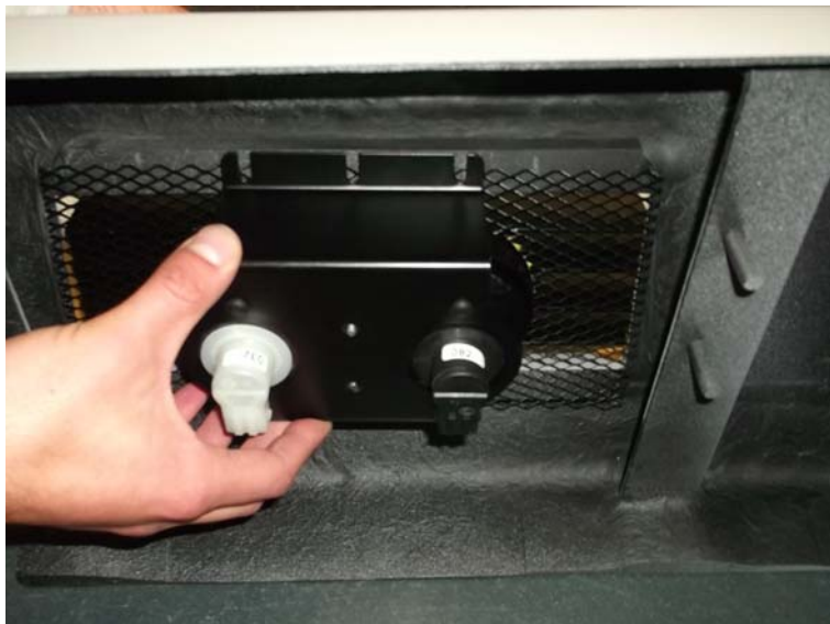
Bild 8: Markieren wo geschraubt wird Figure 8: Mark the screwing points

Fix the expanded metal with the 4 screws (Figure 2, part 7). Pre-drill the screwing points with 3,5mm drill (Figure 8).