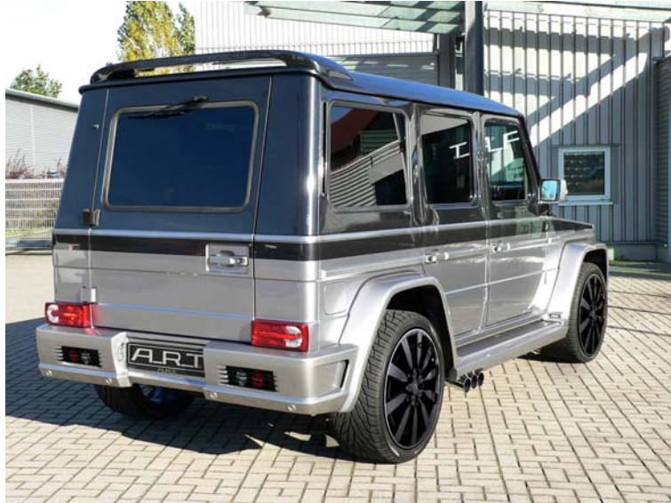
Bild 1: Heckansicht mit HI03 463 00 Figure 1: Rear view with HI03 463 00