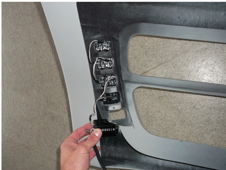
Bild 5: Montage Tagfahrleuchten Figure 5: Mounting daytime running lights

Insert daytime running lights into the front bumper left and right. Use the fixation bars (Figure 2, part 3) and the screw figure 2, part 7 and the flat washers figure 2, part 8. See picture 5.