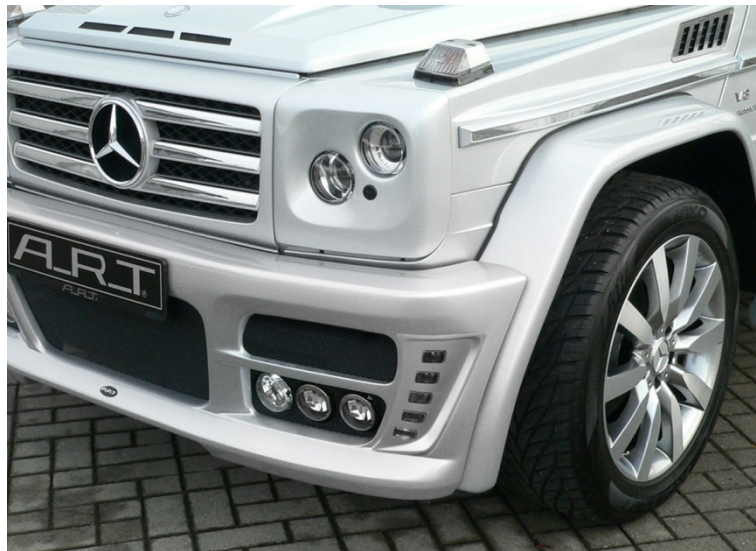
Bild 1: Frontansicht mit DL03 463 00 Figure 1: Front view with DL03 463 00