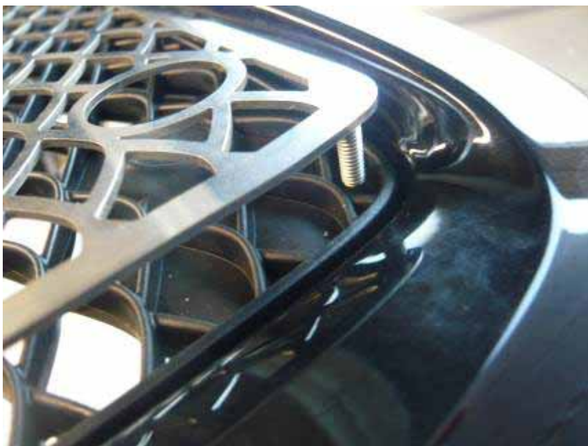
Bild 3: Übertragen der Bohrlöcher Figure 3: Transfer of drill holes

Dismantle original front bumper according to manufacturer's instructions. Apply A.R.T. stainless steel grids to original grids and transfer the drill holes (see figure 3).