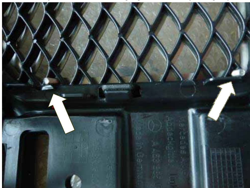
Bild 4: Störende Kanten entfernen Figure 4: Remove distracting edges

Drill holes with a diameter of 4,5mm. Remove distracting edges on the inside of the original front bumper (see figure 4).